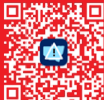
Hazards Near Me