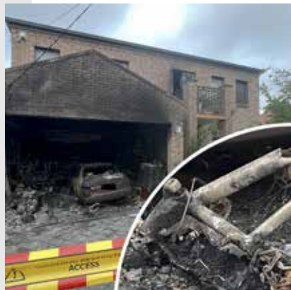
전기 자전거의 불량 리튬 배터리가 화재를 일으켜 주택을 심하게 훼손한 결과.